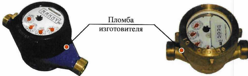
Рисунок 1 – Общий вид счетчиков исполнения Пульсар \text{MX}_1^{1)} и место пломбировки