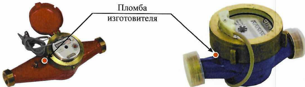
Рисунок 3 – Общий вид счетчиков исполнения Пульсар \text{MX}_1\text{-И}^{1)} (Пульсар \text{MX}_1\text{-RS-485}^{1)} ) и место пломбировки