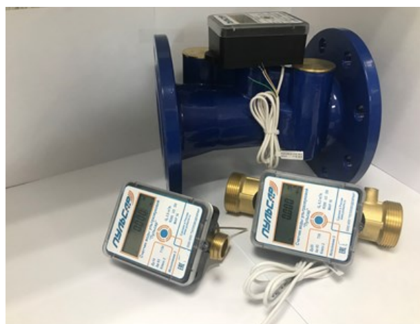
Рисунок 3 – Общий вид счетчиков с электронным блоком модели 2