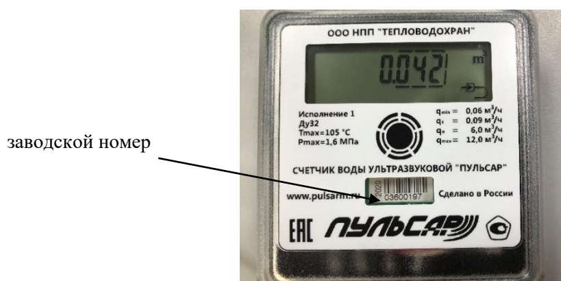
Рисунок 2 – Пример маркировки счетчика с электронным блоком модели 1