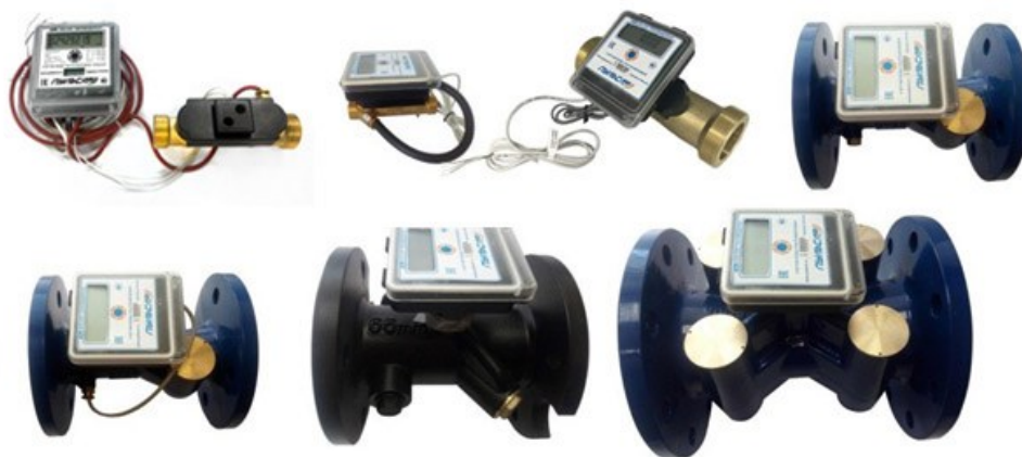
Рисунок 1 – Общий вид счетчиков с электронным блоком модели 1