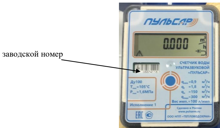
Рисунок 4 – Пример маркировки счетчика с электронным блоком модели 2

Заводской номер счетчика индицируется на жидкокристаллическом экране и наносится на маркировочную наклейку типографским методом в виде цифрового обозначения.