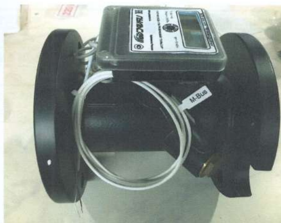
Рисунок 5 - Счетчик воды с импульсным выходом Рисунок 6 - Счетчик воды с выходом M-Bus

Схема пломбирования счетчиков представлена на рис. 7