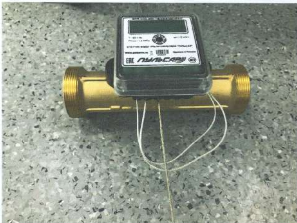
Рисунок 3 - Счетчик воды с радиомодулем.