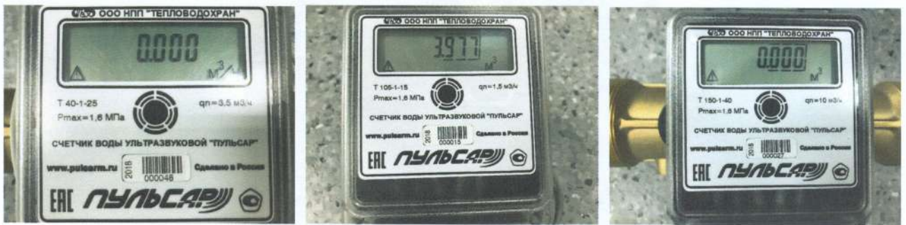
Рисунок 2 - Пример обозначения исполнений T40, T105, T150