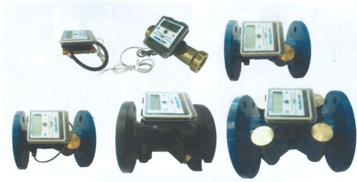
Рисунок 1- Общий вид счетчиков