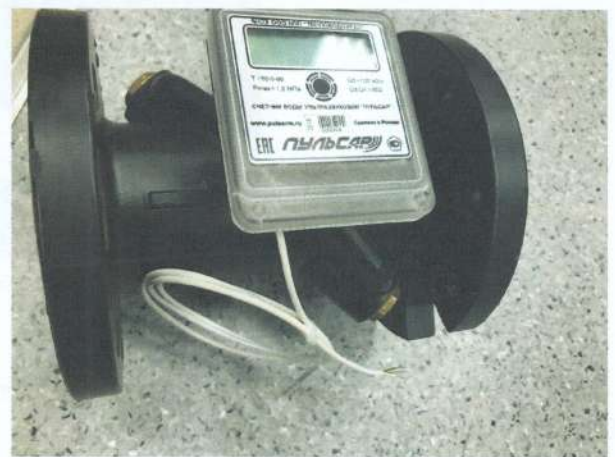
Рисунок 4 - Счетчик воды с выходом RS-485